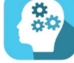
Creative and Critical Thinker