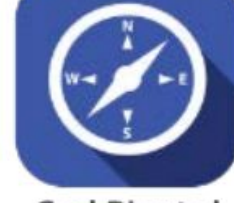
Goal-Directed and Resilient Individual